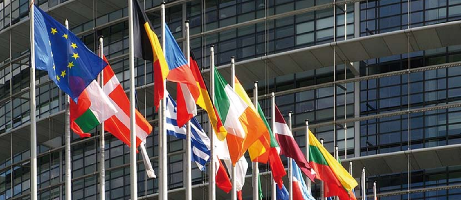
Starke Gemeinschaft – Staatsflaggen der EU-Mitglieder vor dem Europäischen Parlament.