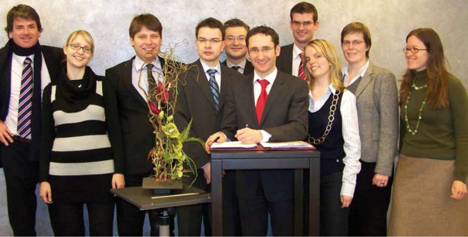
Ihr Herz schlägt für den KKV: Das Planungsteam des KKV-Juniorenkreises München hat im winterlichen Ambiente des Chiemsees ein Leitbild erarbeitet: „Der Menschen steht im Mittelpunkt“.