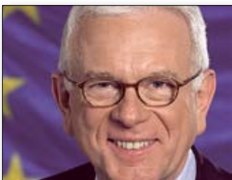
Der Wähler entscheidet Interview mit Hans-Gert Pöttering