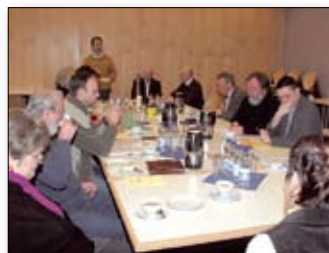
Gute Basis für weitere Arbeit Region Ost beschließt Satzung