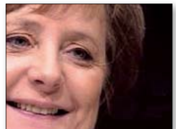
Die Kanzlerin Biografie über Angela Merkel