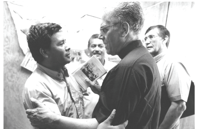
Unter Brüdern: Für die Menschen in Lateinamerika war Weihbischof Grave immer einer der „Ihren“

Die Ortskirchen in Lateinamerika und Deutschland stehen vor der Herausforderung einer pastoralen Neuorientierung. In Lateinamerika erfordern das rapide Anwachsen der Sekten, soziale Ausgrenzung und ein rasanter gesellschaftlicher Wandel neue pastorale Antworten - in den deutschen Diözesen machen personelle und organisatorische Umstrukturierungen eine Reflexion über Ziele und Formen der Pastoral unumgänglich. Hier wie dort geht es um einen Brückenschlag in die Zukunft; dabei sind Ähnlichkeiten und Unterschiede zu erkennen.